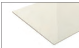
alternative Glasfarbe optiwhite