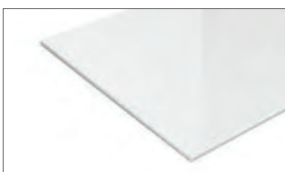
alternative Glasfarbe weiß